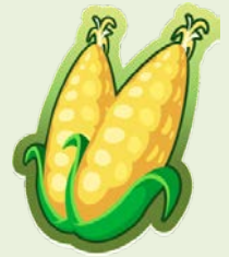
โดย...ปิ่นเพชร

เมื่อต้มข้าวโพดนานๆ สารต้านอนุมูล อิสระและกรดเพอร์ลูริกจะถูกปล่อยออกมาใน รูปแบบที่เป็นอิสระ ดังนั้นยังต้มข้าวโพดหวาน นานๆสารต้านอนุมูลอิสระถูกปล่อยออกมา ขึ้น ตามลำดับของเวลาที่ใช้ในการต้ม